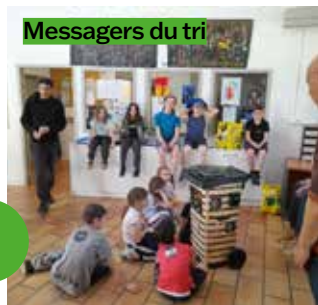
Messagers du tri