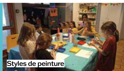
Styles de peinture