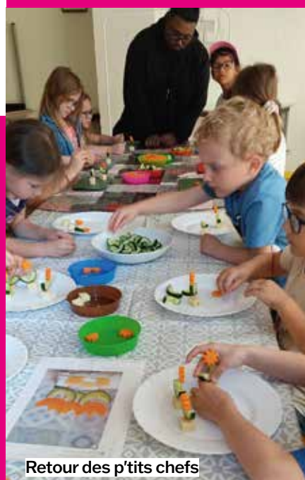
Retour des p'tits chefs