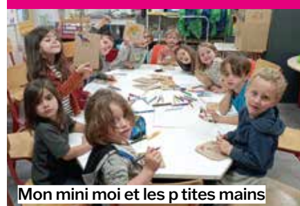
Mon mini moi et les p'tites mains