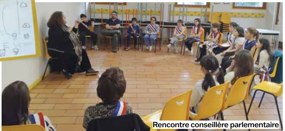
Rencontre conseillère parlementaire