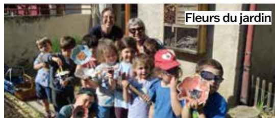
Fleurs du jardin