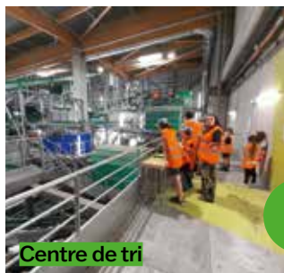
Centre de tri