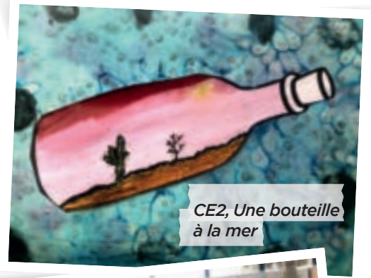
CE2, Une bouteille à la mer

Le réchauffement climatique en accroît la conscience : dans certaines régions du monde, la montée des eaux menace la survie de populations et de territoires; dans d'autres, son absence désertifie des lieux et en chasse les habitants. Or, l'eau a toujours permis de penser et de créer en tous domaines. Dans les grottes préhistoriques, elle dissolvait argiles et pigments pour donner corps à des fresques à l'origine de la peinture.