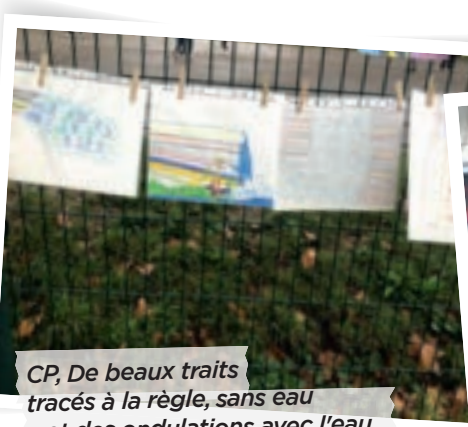
CP, De beaux traits tracés à la règle, sans eau et des ondulations avec l'eau