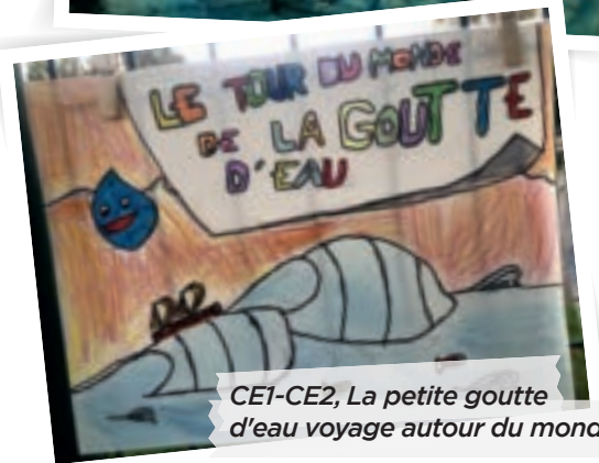
CE1-CE2, La petite goutte d'eau voyage autour du monde