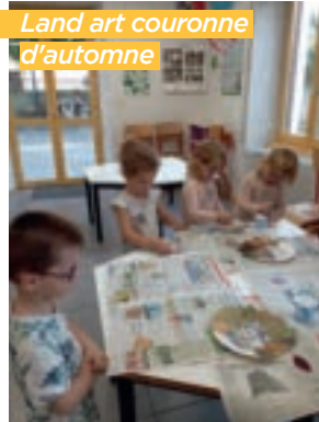
Land art couronne d'automne