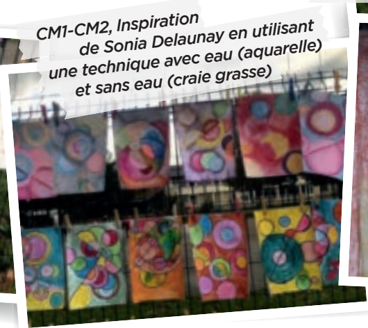
CM1-CM2, Inspiration de Sonia Delaunay en utilisant une technique avec eau (aquarelle) et sans eau (craie grasse)