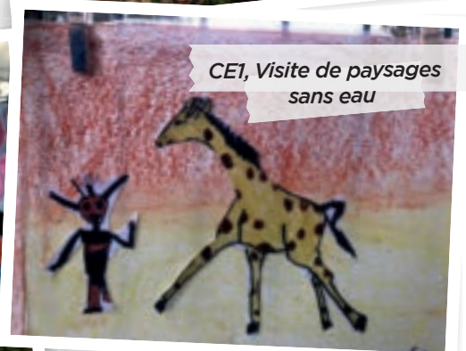
CE1, Visite de paysages sans eau