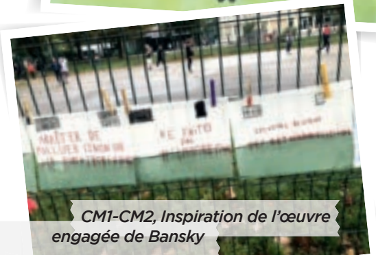
CM1-CM2, Inspiration de l'œuvre engagée de Banksy