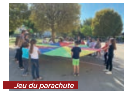
Jeu du parachute