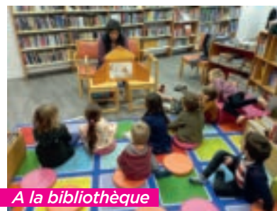
A la bibliothèque