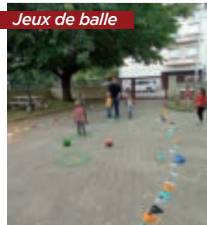
Jeux de balle