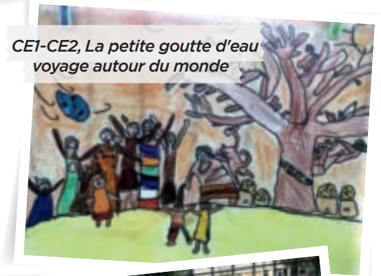
CE1-CE2, La petite goutte d'eau voyage autour du monde