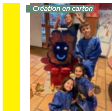
Création en carton