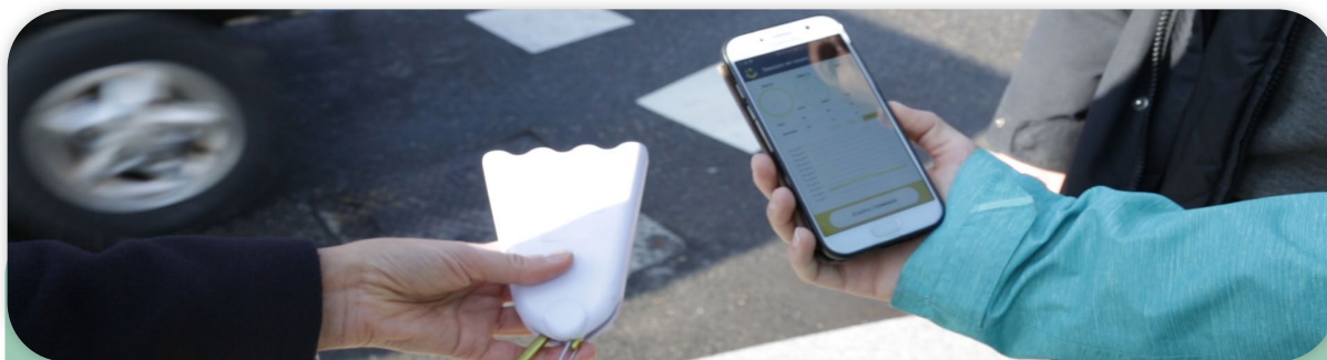
Les citoyens peuvent emprunter un micro-capteur mobile et mesurer les particules fines

En plus de mesurer leur air, les participants se verront proposer un accompagnement pour les inviter à mesurer des phénomènes de pollution extérieur ou intérieur caractéristiques, via des missions ou des challenges de mesure. Des fonctionnalités d'échanges et de partage ainsi que des ateliers avec les experts d'Atmo Auvergne-Rhône-Alpes complètent le dispositif.