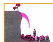
Le risque majeur

Les risques majeurs sont classés en deux familles :